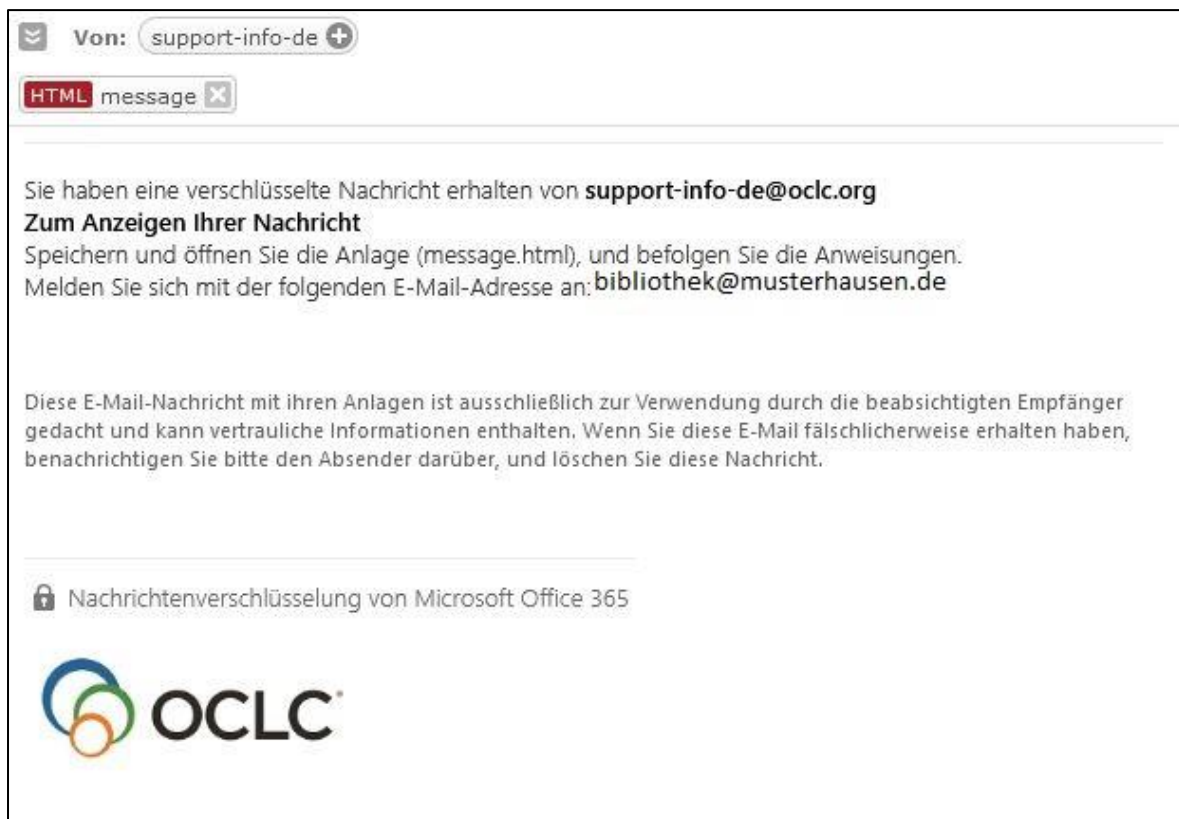
Abbildung 1: Ansicht verschlüsselte E-Mail

Ein verschlüsselte E-Mail von OCLC sieht so aus: